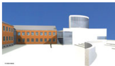
Den nya kyrkan sett från parken.