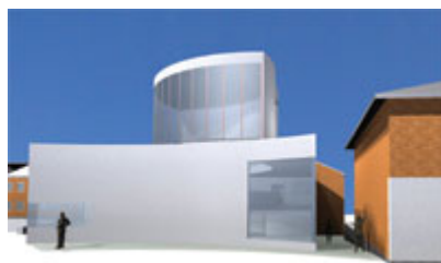
Vy mot gränden.

Vill du få löpande information om Kyrkan i centrum?